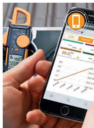
Pohodlné zobrazení a zdokumentování výsledků měření pomocí aplikace testo Smart App .