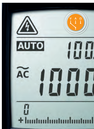
Automatická detekce měřené veličiny