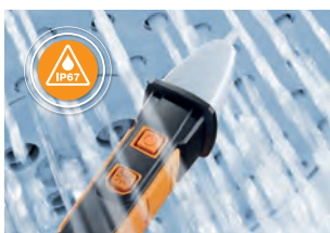
Vodotěsný a prachotěsný podle IP 67.

Bezkontaktní indikátor napětí s rozsahem napětí až do 1 000 V je vhodný především pro rychlou kontrolu všech podezřelých zdrojů poruch. Pokud je zaznamenána přítomnost střídavého elektrického napětí, testo 745 vydá jasný optický a akustický signál. Za účelem zvýšení spolehlivosti je testo 745 vybaveno filtrem, který blokuje vysokofrekvenční interferenční signály.