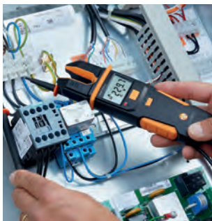
Měření napětí na kompresoru.