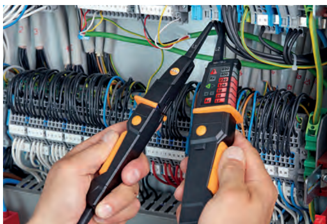
Měření napětí v rozvodné skříni.

Vyhovuje nejnovější normě pro zkoušečky napětí