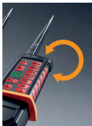
Zkoušečka napětí testo 750 je vybavena 3-stranným LED displejem.