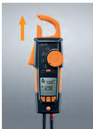
Snadné uchopení těsně rozvedených kabelů.