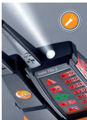
Pohodlné osvětlení měřených míst.