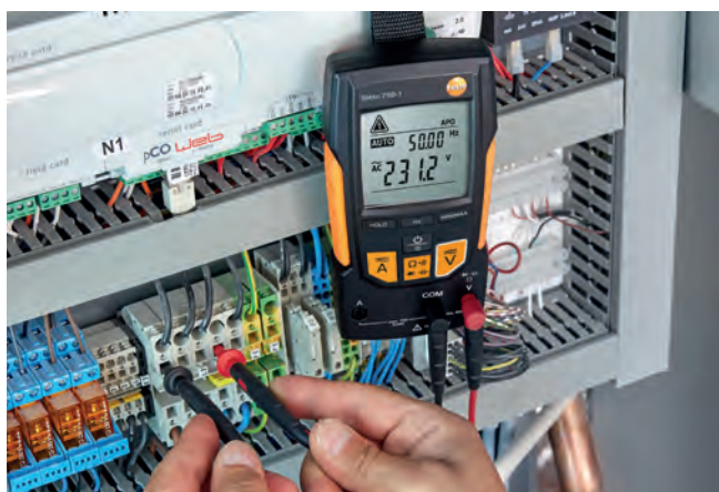
Testování napětí v rozvodné skříni tepelného čerpadla.