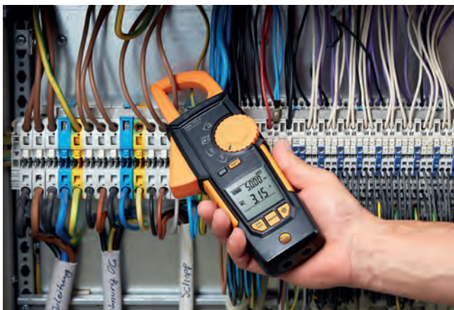
Měření proudu v rozvodné skříně.